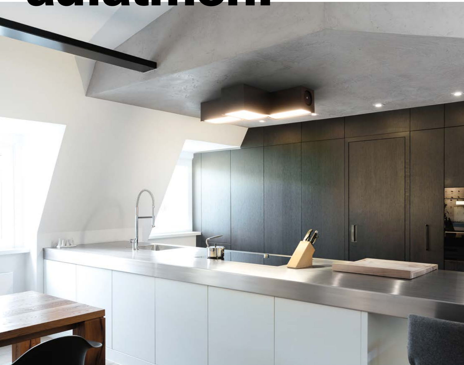
Vollwertige Deckenleuchte und zugleich innovativer Luftreiniger: Stella von Ozonos

Damit einem die Luft nicht wegbleibt: Mit den modernen Luftreinigern kehrt im Wohnraum klare Frischluft ein.