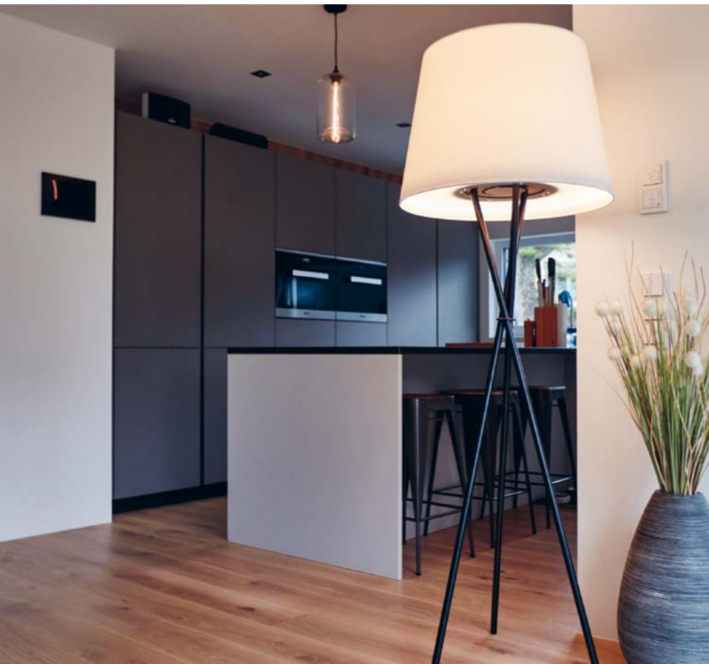
LED-Stehleuchte und Frischluftwunder in einem